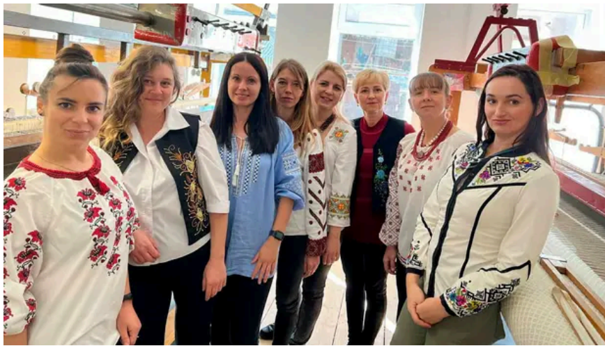
Väverskorna vill stanna i Ukraina och arbeta där.

I början av kriget fick kvinnorna ljuga för att ta sig till arbetet som låg innanför de ryska militärposteringarna. Fabriken fönster täcktes med plywoodskivor.